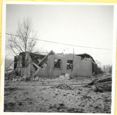
A 5. Personalhus från väster A.9130