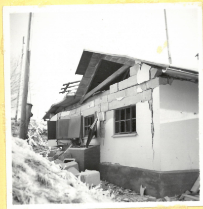
C 8. Torkhus från nordväst. A 9111