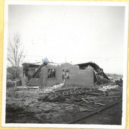
A 5. Personalhus A.9131