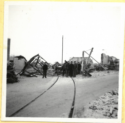
Utanför A 5. Personalhus A.9126