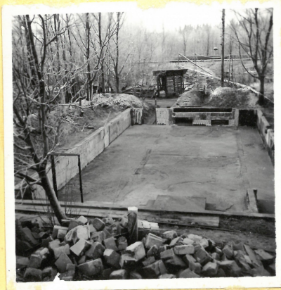
C 3. Torkhus från öster. A.9113