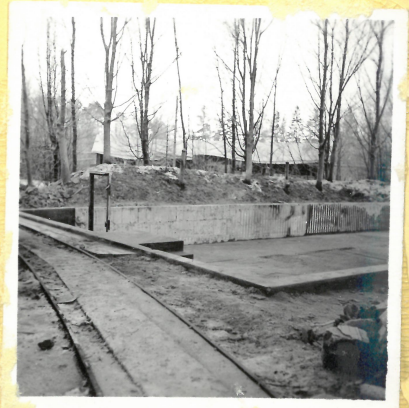
Grund till torkhus C 3. I bakgrunden B 23 (maga- sin. A.9112