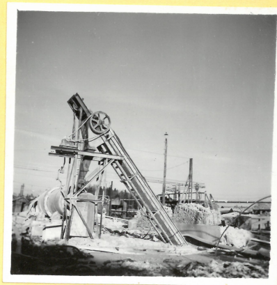
P 1. Kalktransportören kvarstår. A.9086