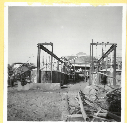
P 2. Kokhus från söder. A.9085