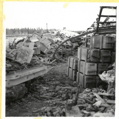
Taget vid D 4. mot väster. A.9106