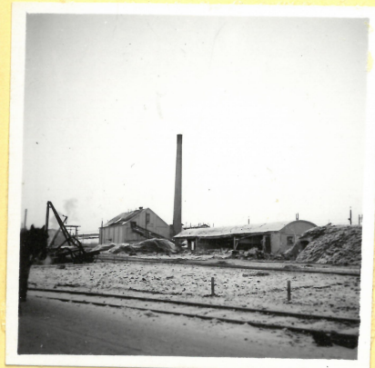
B 31. Apteringshus A 9117