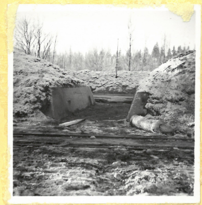
C 9. Ingång till tork- huset A 9110