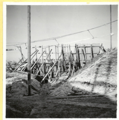
N 16. Pallisad söder om pro- visoriska Ngl-tillverkninge A 9090