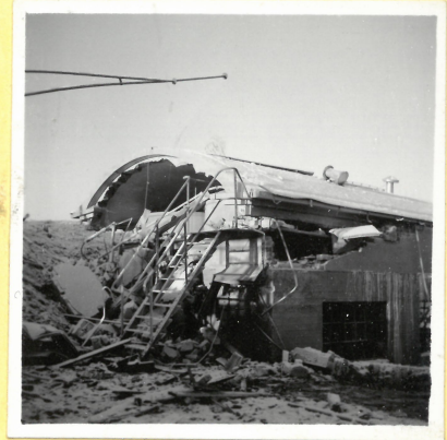
O.6. Massarivningen, f.d. U.21. från söder A.9088