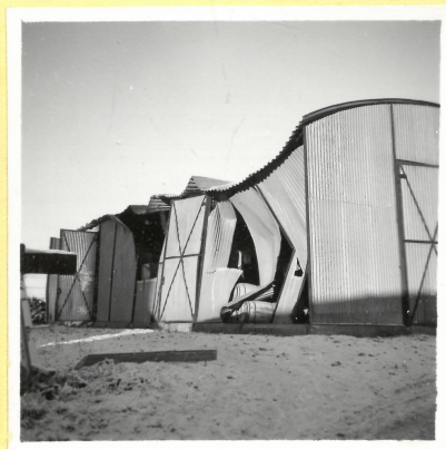
K 5. Plåtmagasin A 9095