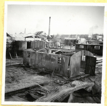
B 25. Plåtmagasin A 9120