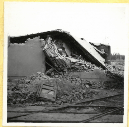
A 5. Personalhus från öster. A.9129