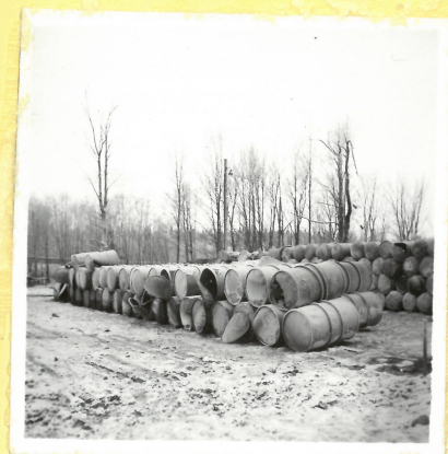
55 ton acetone väster om B 12