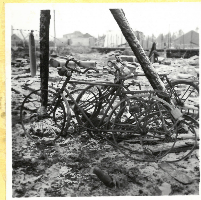
Taget mellan D 4. (hus för svarvning och mål- ning) och V 1 (apterings- hus). A.9105