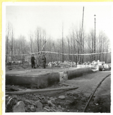
C 22. Torkhus