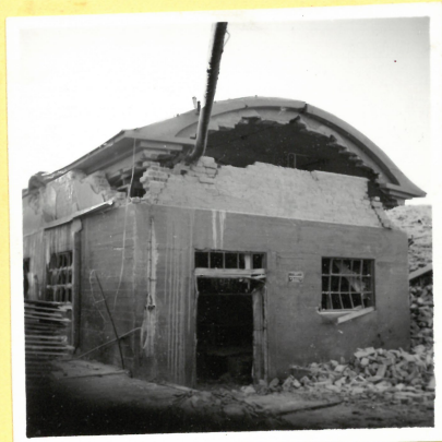
O 4. Massarivningshus, en våning försvunnen. A.9089