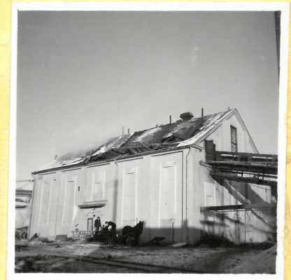
G 4. Ångcentral från syd- väst. A.9099