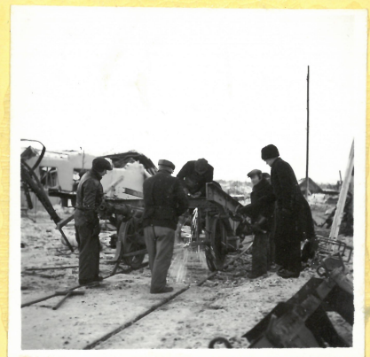
Brandskadad järnvägs- vagn.