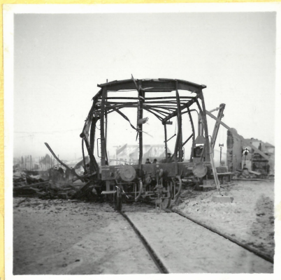
Järnvägsvagn vid A 5. Personalhus