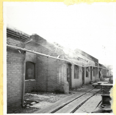
B 12. Knådningshus A.9123