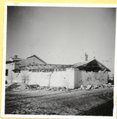
M 2. Pumpstation för älv- vatten. A.9093