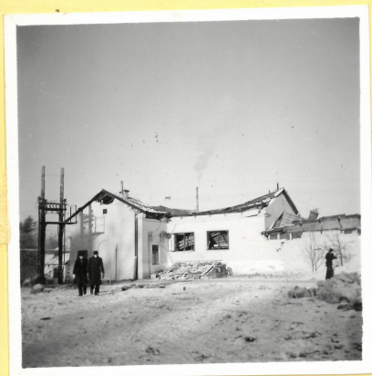
M 2. Pumpstation A.9094