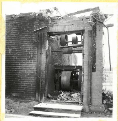
B 9. Presshus för tro- tyl. Del av maskinrum- met A.9125