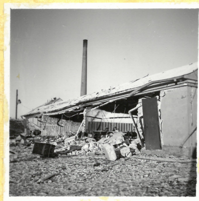
B 31. Krutapteringshus från sydväst. A.9118