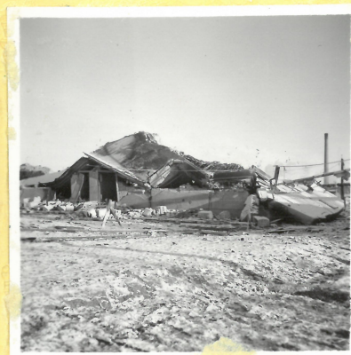
D 5. Apteringshus A.9104