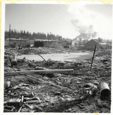
D 1. Krater efter huset. Nu fylld med vatten. A.9108