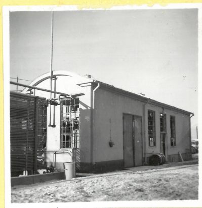
N 2. Chageringshus för nitroglycerin från syd-