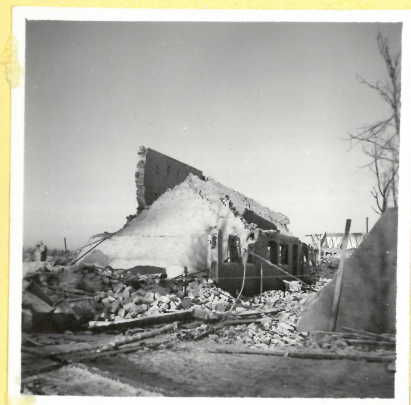
B 14 Krutaptering från söder