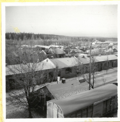
B-längan. I förgrunden F 1. A.9114