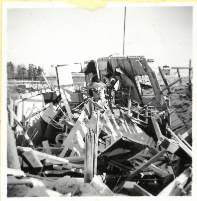
N 16. Provisoriskt nitrerings- hus för nitroglycerin. A.9091