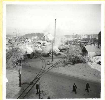
Från K 1. mot norr