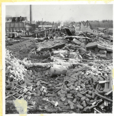
D 4. Apteringshus. A.9107