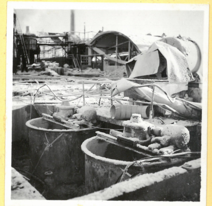
P 1. Neutraliseringsanlägg- ning. I bakgrunden R 5, torkh för cellulosa. A.9087