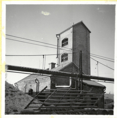
F 3. Kristalliseringen A.9101