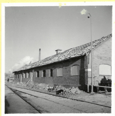
K 3. Murbruksknåd m.m. från söder A.9096