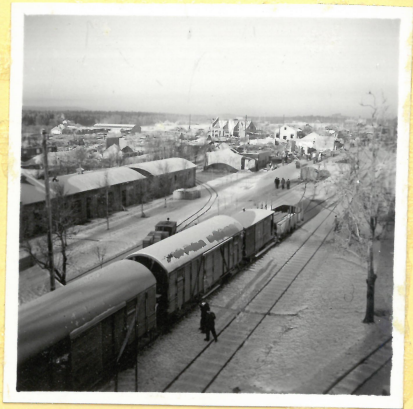
B-längan till vänster. I bakgrunden många för- störda hus. A.9115