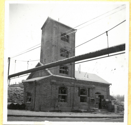
F 3. Kristalliseringshus A.9100