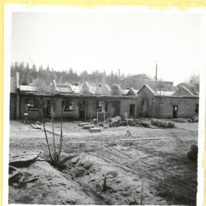
B 12 från väster. A.9124