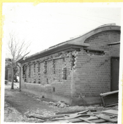
B 33. Massmagasin från nordväst