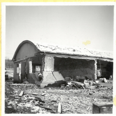
B 31. Krutaptering från väster. A.9119