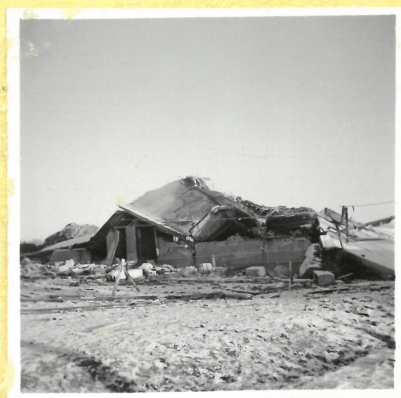
✓ D 5. Hus för aptering och målning av ammuni-